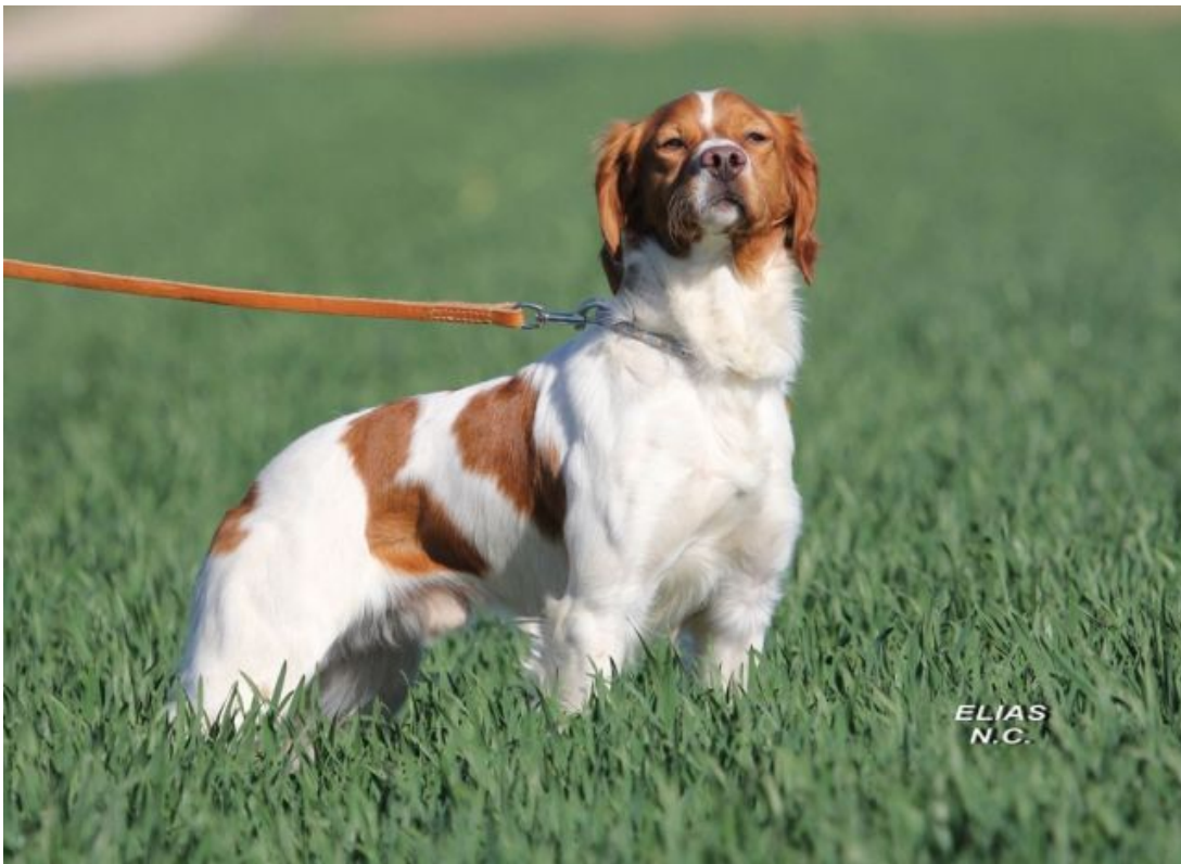
Neymar de Casa Ato Mejor Epagneul bretón Semana Andalucía 2016